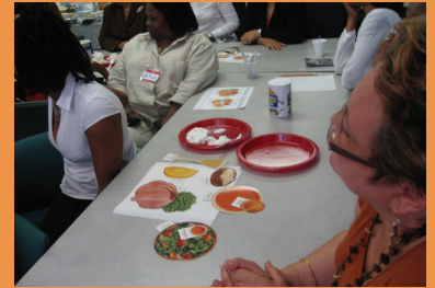
CLASES DE NUTRICIÓN