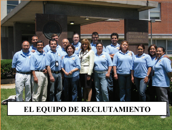
EL EQUIPO DE RECLUTAMIENTO

A nuestros queridos participantes de SOL,